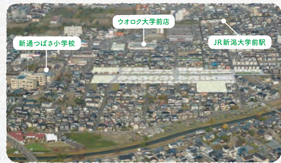
※2020年11月撮影の空撮に完成予想図を合成

西大通、大堀幹線から少し奥まった静かな 環境で、2020年4月1日開校の「新通 つばさ小学校」から徒歩約4分。JR新潟大 学前駅(徒歩約7分)、坂井村上バス停(徒 歩約3分)と通勤通学も便利です。お買い 物も、徒歩圏内に食品スーパー・ドラッグス トア・コンビニが、さらに車で10分前後の ところには大型ショッピングセンターもあり、 子育てや日々の暮らしには絶好の立地です。