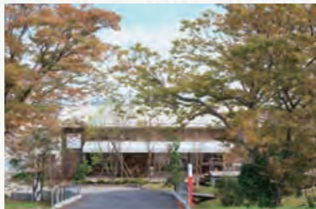
洋菓子店(新潟市江南区)