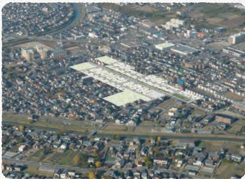
※2020年11月撮影の空撮に完成予想図を合成