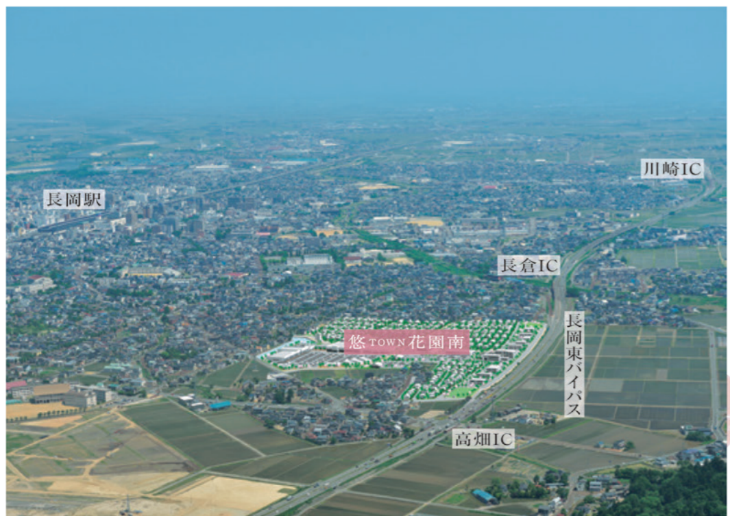
※2 完成配置予想図(南側より望む) 長岡東バイパスからの直結乗り入れ道路は、平成28年度中の共用を目指し、現在協議中です。

お山の麓の安心感。 悠タウン花園南は、東に悠久山を望む絶好の立地にあります。長岡市民に愛され続ける悠久山のふもとでの暮らしは、安らぎに満ちた日々になります。