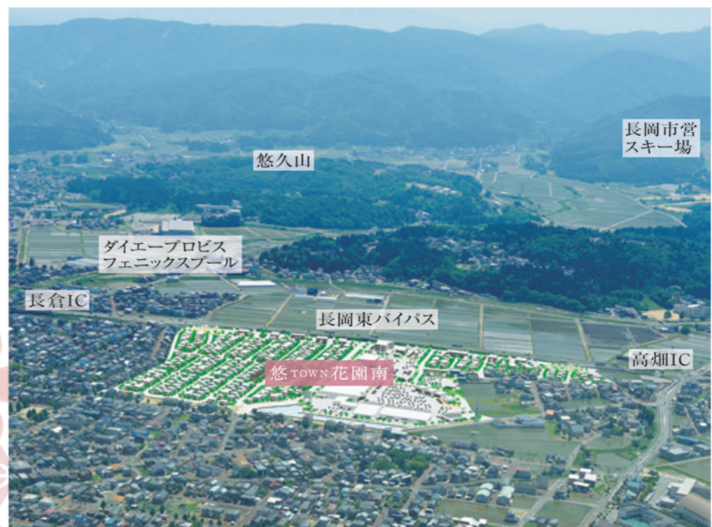
※1 完成配置予想図(西側より望む) 長岡東バイパスからの直結乗り入れ道路は、平成28年度中の共用を目指し、現在協議中です。

未来を描く期待感。 近い将来、長岡東西道路と国道17号長岡東バイパスの結節が予定され、悠タウンから川西地区へのアクセスや広域交流の利便性の向上が期待されています。