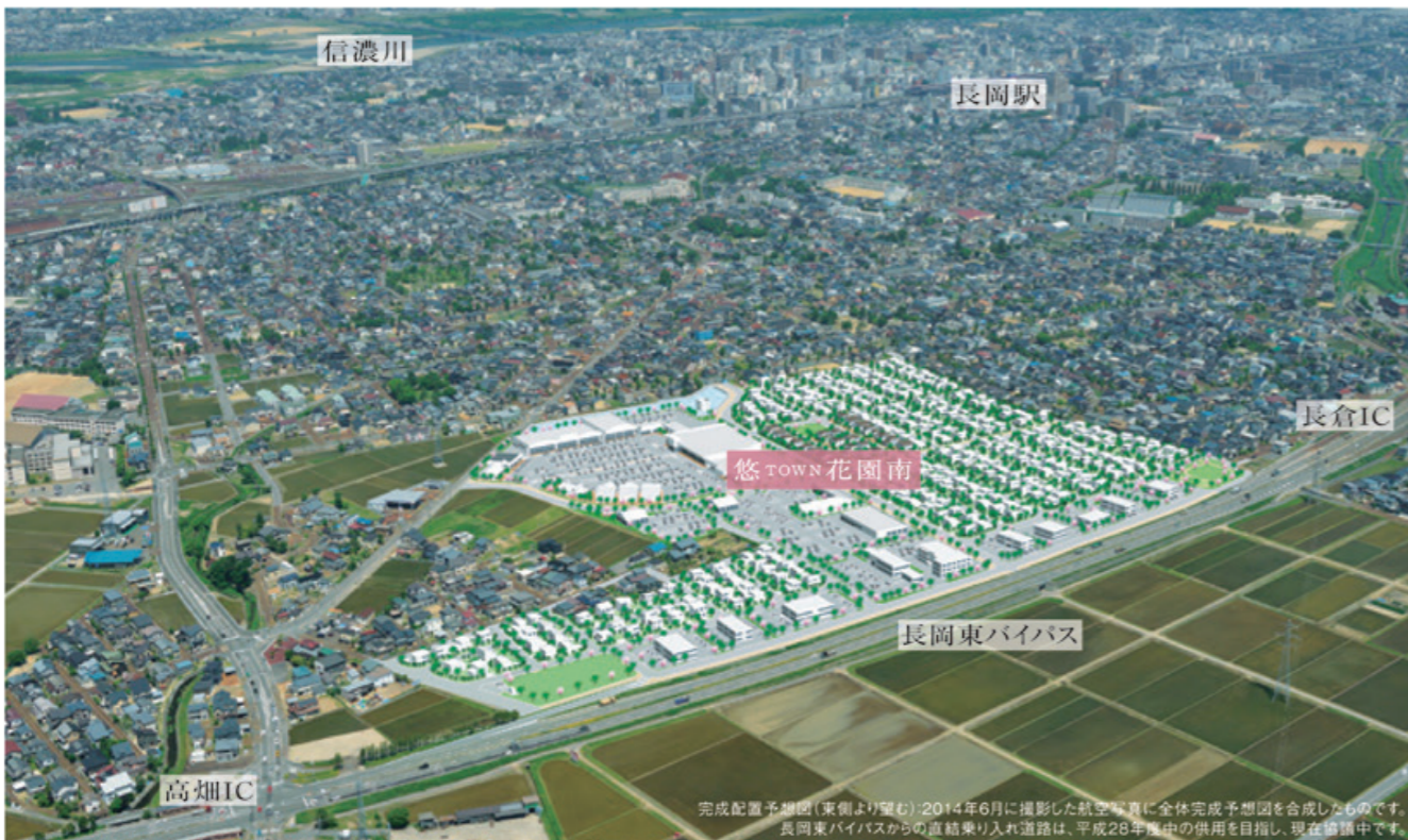
完成配置予想図(東側より望む) 2014年6月に撮影した航空写真に全体完成予想図を合成したものです。長岡東バイパスからの直結入り入れ道路は、平成28年度中の供用を目指し、現在施工中です。